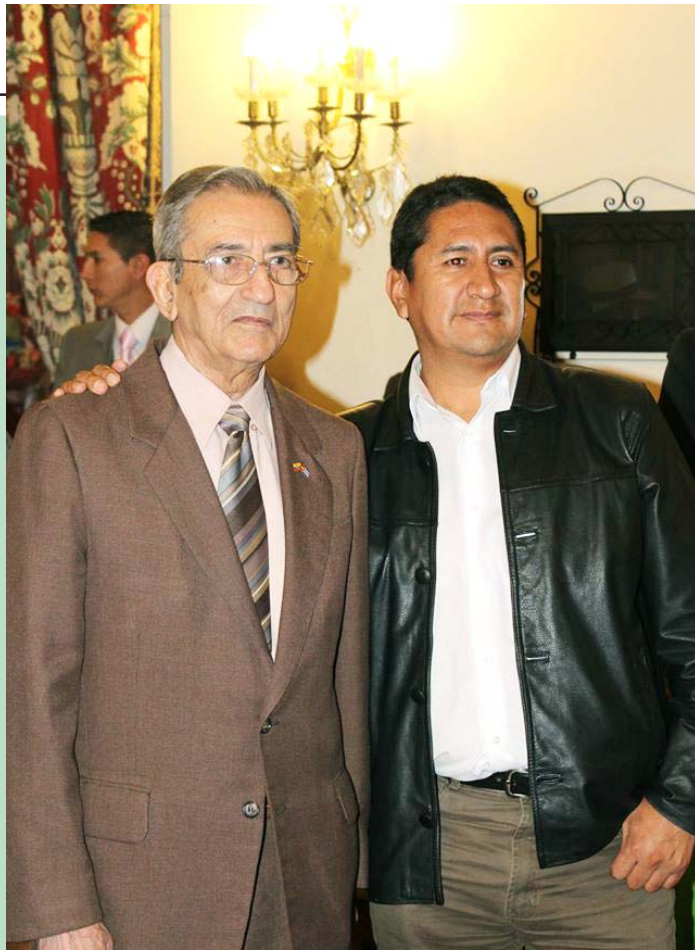
Con José Ramón Balaguer Cabrera, Miembro del Secretariado y Jefe del Departamento de Relaciones Internacionales del Comité Central del Partido Comunista de Cuba y Vladimir Cerrón Rojas, líder del Partido Político Nacional PERÚ LIBRE

Somos el aire fresco de un partido que abre una valiosa perspectiva de lucha, organización y construcción política. Somos gente de paz, pero en tiempos de guerra lucharemos hasta la victoria siempre!!!