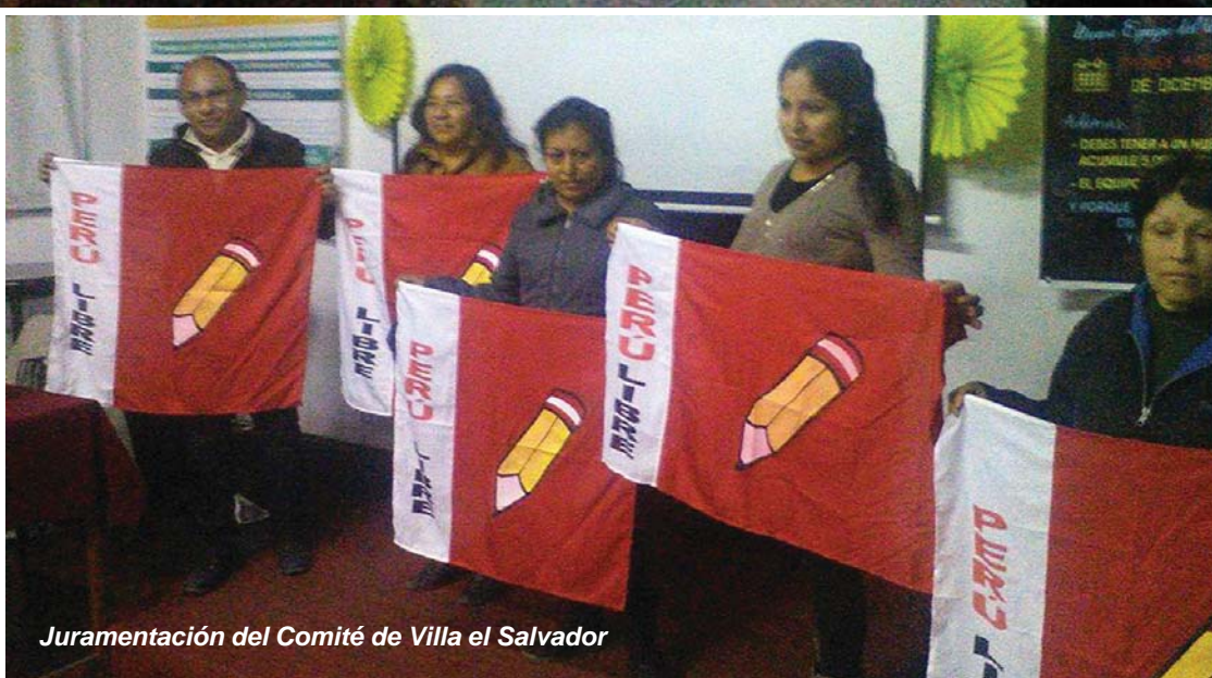
Juramentación del Comité de Villa el Salvador

El Partido es una herramienta valiosa de reivindicación, es la casa de todos nosotros, es la familia cualitativa sobre la familia cuantitativa. El Partido no es un instrumento que se luce solamente en el proceso electoral, porque hay quienes piensan que si no hay elecciones no hay Partido ni actividad política, craso error. El Partido y sus concepciones deben estar en todo, en el trabajo con la eficacia y calidad que demanda cada tarea profesional, en el estudio que nos llama a la superación, en la producción intelectual revolucionaria o por lo menos progresista, en nuestra conducta social, en la guía