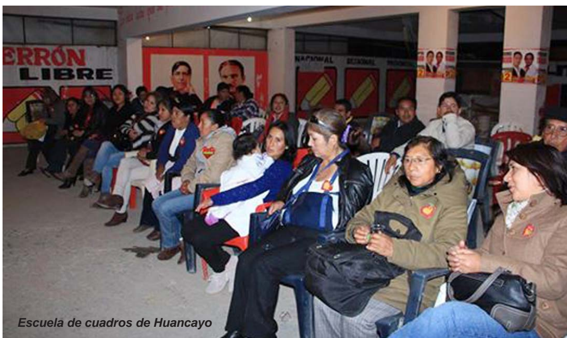
Escuela de cuadros de Huancayo

«es grato conocer que compatriotas que aportaron todo su esfuerzo económico, social, político y laboral a la causa de la lucha, pese a las contradicciones y sin intereses de por medio, fortalecieron su espíritu revolucionario y hoy asumen la nueva imagen generacional partidaria de Perú Libre, a ellos mi reconocimiento, mi saludo y respetos.»