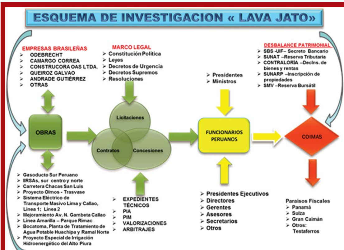
Rigurosidad académica: Esquema de investigación comprendió el pago de las coimas y el "servicio" delictivo prestado por los funcionarios corruptos a cambio de ellas.

caso del Sistema Nacional de Inversión Pública (SNIP)