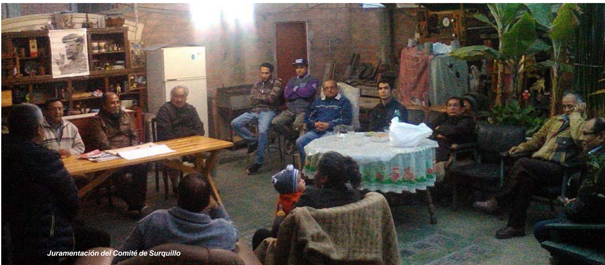
Juramentación del Comité de Surquillo

pero en el fondo solo querían obtener prestigio social y rentabilidad económica, cuál financiera bancaria o empresa privada. A estos advenedizos, que en realidad eran invitados, les recuerdo el discurso del gran Pepe Mujica cuando aconsejaba a estos "decepcionados" y "despechados" de la política: "Si quieren servir al pueblo sean políticos, pero si quieren dinero vayan a ser empresarios".