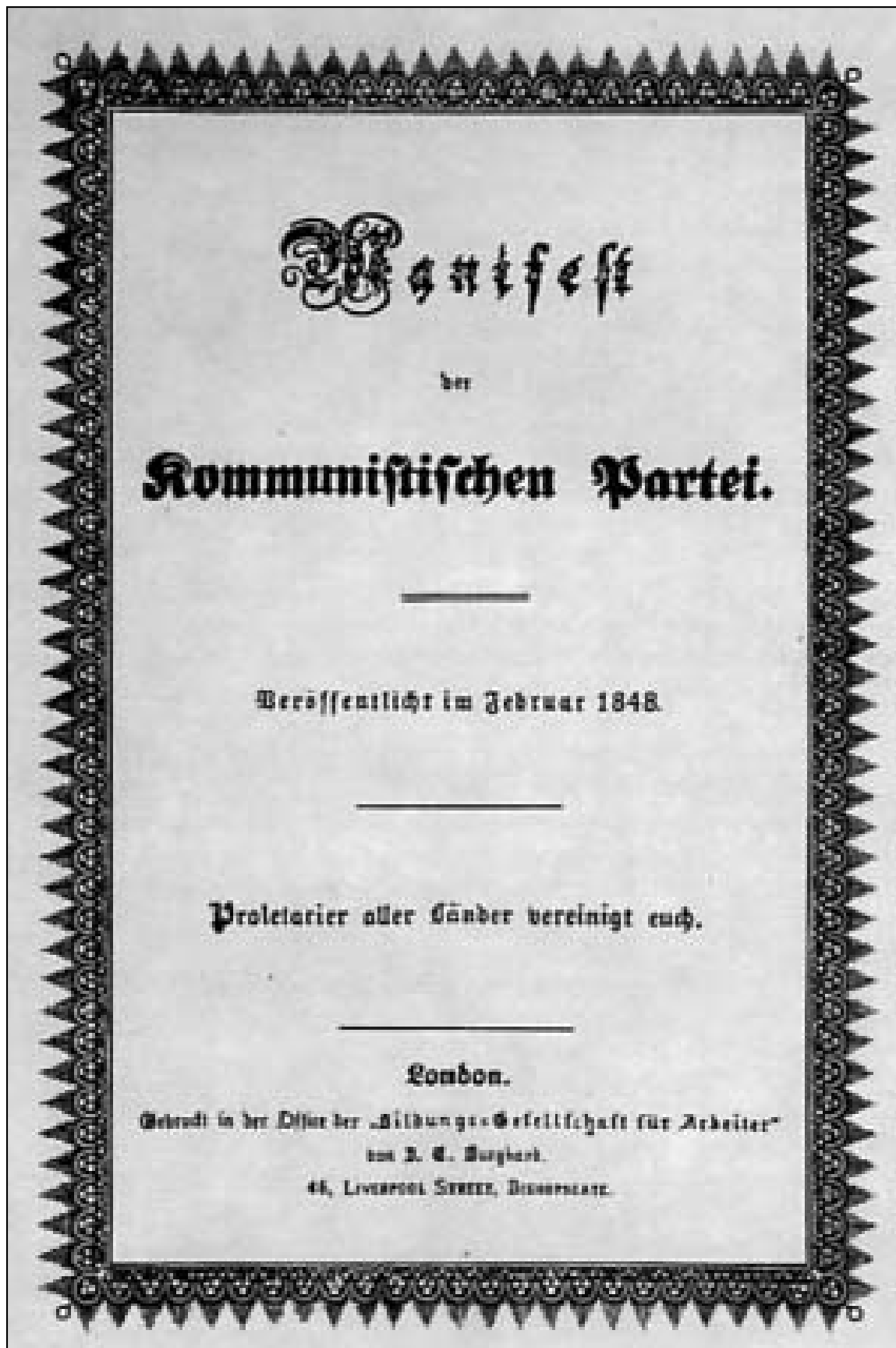
Portada de la primera edición del Manifiesto del Partido Comunista