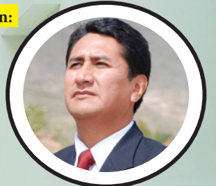
Vladimir Cerrón Sec. General Nacional