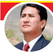
Vladimir Cerrón Rojas Secretario General del Partido Perú Libre

Nuestros jóvenes peruanos migran por oportunidades que no encuentra en un país con marcadas diferencias de clases sociales.