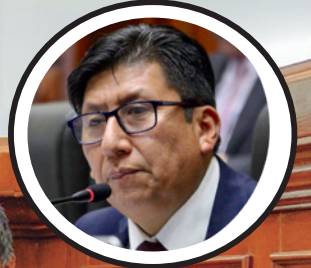
Waldemar Cerrón Sec. de Ideología Nacional