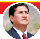
Vladimir Cerrón Rojas Secretario General del Partido Perú Libre

Se APROBÓ en la Comisión de Trabajo y Seguridad Social, la ampliación para el retiro de CTS. Ahora pasará a la comisión de Economía; donde estamos seguros se aprobará. Los trabajadores necesitan su CTS para afrontar la recesión económica que se vive.