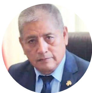
Abog. Isaac Mita Alanoca Congresista de la República

Es por ello muy importante que el Estado a través de la representación nacional, pueda brindar una mejor calidad de vida a las personas con discapacidad, en este caso ampliando la cobertura del beneficio a favor de quienes sufren de discapacidad moderada, para que la Ley 29973 Ley General del Discapacitados, sea verdaderamente útil; en marco además a lo establecido por la Constitución Política del Estado, en su Artículo 1°, donde señala como un derecho fundamental "la defensa de la persona humana y el respeto de su dignidad son el fin supremo de la sociedad y del estado", por seguiremos luchando para que esta iniciativa legislativa sea aprobada ahora en el pleno del Congreso, reiterando que nuestra labor de representar a los más necesitados, siempre estará presente, desde mi despacho seguiremos abordando este y otros temas en defensa de nuestra población peruana.