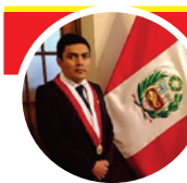
Américo Gonza Congresista de la República

Valieron la pena todos los meses de exhaustivas gestiones, en defensa de los trabajadores y ex trabajadores que han aportado con tanto sacrificio. A pesar del intento de boicot, la fuerza del pueblo siempre gana. ¡Hasta más allá de la victoria! Devolución de 4 UITs de AFPs para todos.