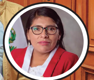
Margot Palacios H. Congresista de la República