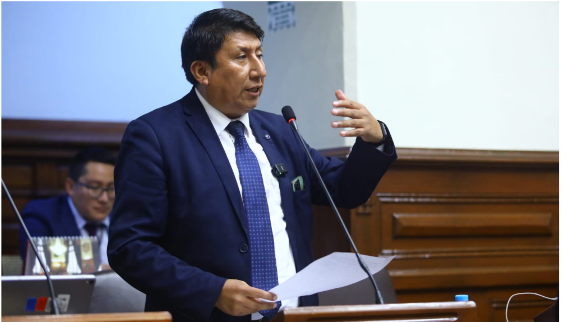
Dr. Vladimir Cerrón Secretario General Nacional