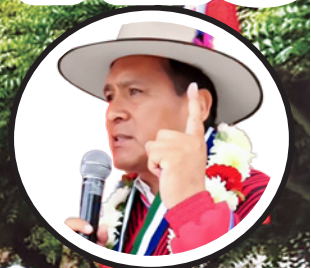
Flavio Cruz Mamani Congresista de la República