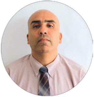
Escrito por: Augusto Lostaunau Secretario de Ideología de Lima Metropolitana

Mientras todos están mirando los Rolex originales (aquellos de 14 o 16 mil dólares) o los “bambas” (que la prensa indica su fabricación en China, para seguir alimentando la teoría que todos los productos chinos son “bambas”, por lo tanto, de mala calidad). Mientras todos conversan y opinan sobre el libro de incidencias “perdido” y “recuperado” totalmente alterado en su información. Mientras resuenan aún los viejos ecos del “pásame tu cv” que determinó la renuncia de un Premier que, durante su mandato, se produjeron ejecuciones extrajudiciales. Ahora, la Prensa Basura desarrolla una “noticia bomba”: se han visto los autos oficiales de la dictadora cerca del “lugar donde se escondía el prófugo Vladimir Cerrón”.