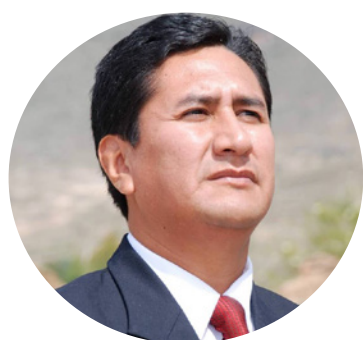
Dr. Vladimir Cerrón Sec. General Nacional