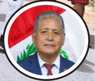
Isaac Mita Alanoca Congresista de la República

Los artículos periodísticos, tienen relación con el Ideario del Partido Político Perú Libre