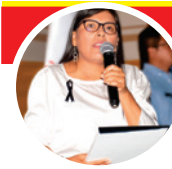
Margot Palacios Huamán Congresista de la República

Presenté el Proyecto de Ley 7526/2023-CR, Ley que declara el día 23 de marzo de cada año como el "Día de la gesta histórica de la lucha del Valle de Tambo", honrando al valeroso pueblo que rechaza a las mineras transnacionales, como la corrupta Southern Perú.