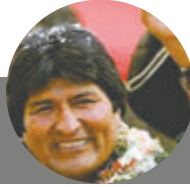
EVO MORALES AYMA @EVOESPUEBLO

CON LA MORAL EN ALTO. En franco abuso judicial la Sala de Apelaciones de Extinción de Dominio ordena extinguir mis sueldos de médico en EsSalud, gobernador regional en GRJ y docente universitario en la UNCP, de 20 años de trabajo, debidamente acreditados. La ley no se puede aplicar retroactivamente y tampoco tengo sentencia penal, violándose la ley y la jurisprudencia del TC flagrantemente. Apelaré la decisión.