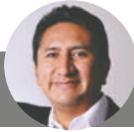
VLADIMIR CERRÓN SECRETARIO GENERAL PERÚ LIBRE @VLADIMIR_CERRÓN

CON LA MORAL EN ALTO. En franco abuso judicial la Sala de Apelaciones de Extinción de Dominio ordena extinguir mis sueldos de médico en EsSalud, gobernador regional en GRJ y docente universitario en la UNCP, de 20 años de trabajo, debidamente acreditados. La ley no se puede aplicar retroactivamente y tampoco tengo sentencia penal, violándose la ley y la jurisprudencia del TC flagrantemente. Apelaré la decisión.