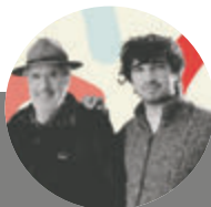
ATILIO BORON Sociólogo y politólogo @atilioboron

Temen a lo que ocurrirá: el rechazo de la abrumadora mayoría de la comunidad internacional a su política genocida y de asfixia económica contra Cuba.