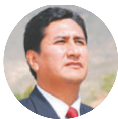
■ Vladimir Cerrón

“ Ante esta tesis y antítesis, el Partido debe aterrizar en una síntesis dialéctica. Claro que “revancha” suena agresivo, pero no lo entendamos como una agresión física, sino como un estímulo injurioso neuronal en cada uno de nosotros, que nos permitirá salir de esa “comodidad mental alienante”, que prefiere tomar términos que el statu quo nos pone a la mano. ”