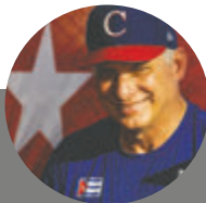
MIGUEL DÍAZ CANEL BERMÚDEZ @DIAZCANELB

El Poder Judicial abre juicio contra Cerrón, Bermejo y Bellido. Dicen "terrorismo", pero huele a persecución política. Cerrón, el único rojo de verdad, paga los platos rotos mientras el rosado Bermejo coquetea y el azul Bellido se esconde. En Perú, ser rojo sigue siendo delito.