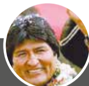
EVO MORALES AYMA @EVOESPUEBLO

La solución a la crisis en nuestro país pasa fundamentalmente por el cambio de Constitución a través de una Asamblea Constituyente. No obstante, el pacto mafioso entre Keiko y Sánchez garantiza la continuidad de la Constitución fujimorista de 1993, que es la madre de la ruina y la gran corrupción en el Perú.