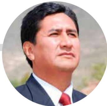
Vladimir Cerrón R.

“La intangibilidad del sistema fujimorista está garantizada con Keiko Fujimori o Roberto Sánchez, no tengo ninguna duda.”