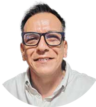
■ César Merino Cifre

El Amauta que sigue caminando junto al pueblo